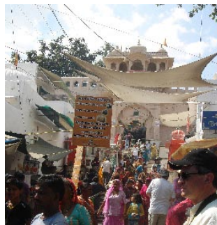
Temple de Brahma à Pushkar © Allevard