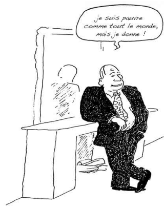
PROTESTANT VERSION « LIGHT »

L'équipe financière Situation au 10 novembre